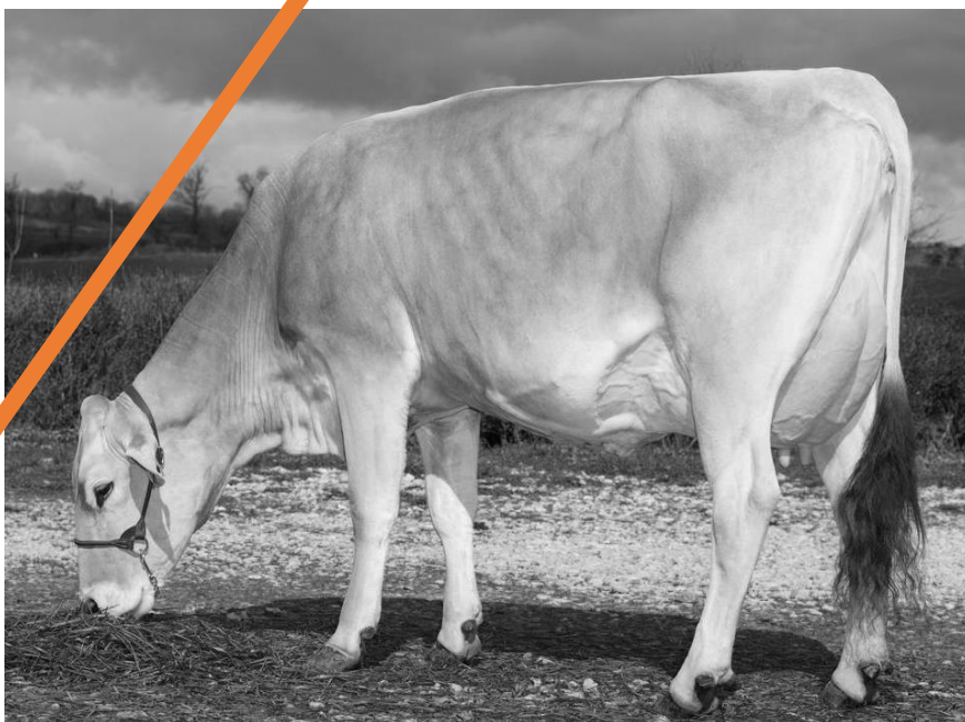
Pom Ipiano LANCELOT, mère d'Osbourne

uatrième lactation et a produit IA pour cinq gestations ! ui a produit en 305 jours 9 138 térozygote VIVEK P, spécialiste