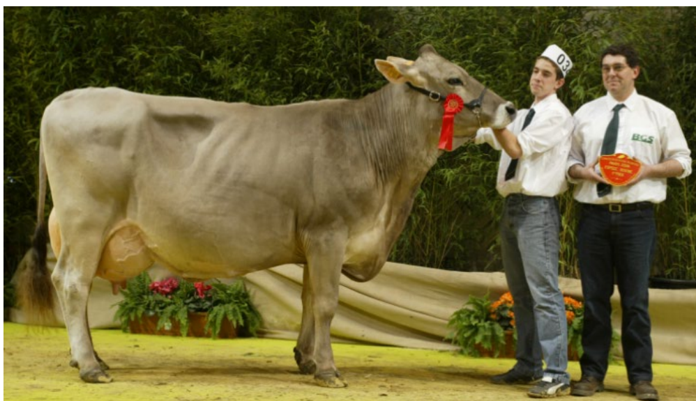
Vinbrei PARISIENNE EX 90 quatrième mère du lot N° 2