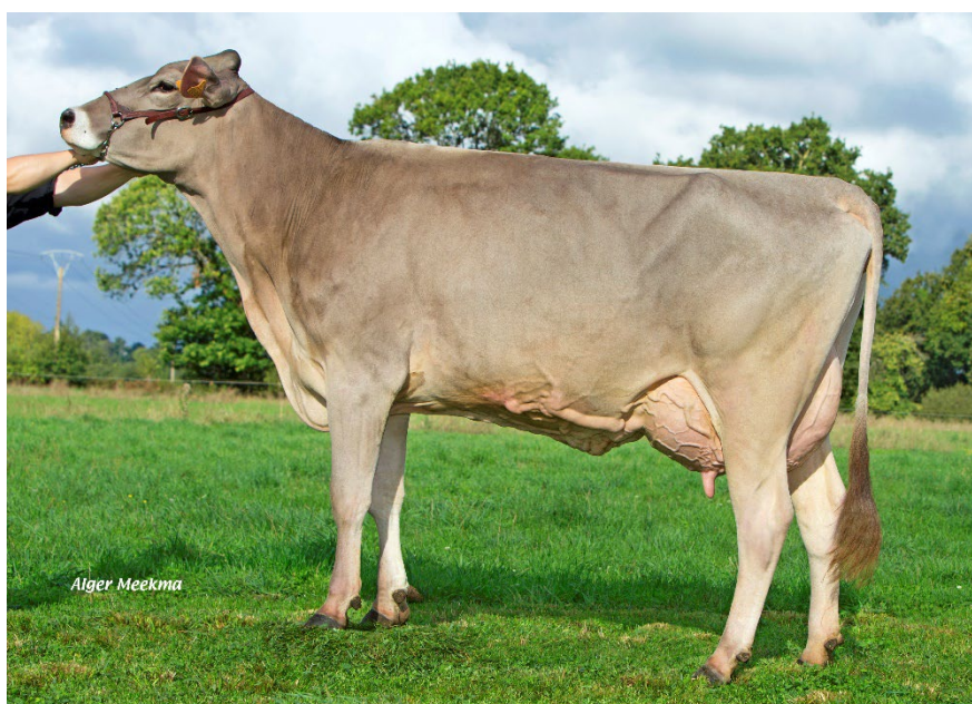
Hamster LECTURE, mère de PHENIX