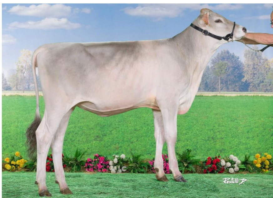
SUBLIME, fille de PACTOLE