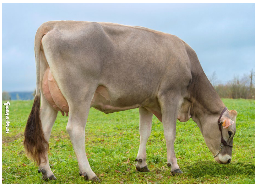
Payssli HABILE TB 85, grand-mère de RHABILE