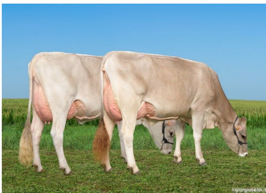
Filles d'O Malley