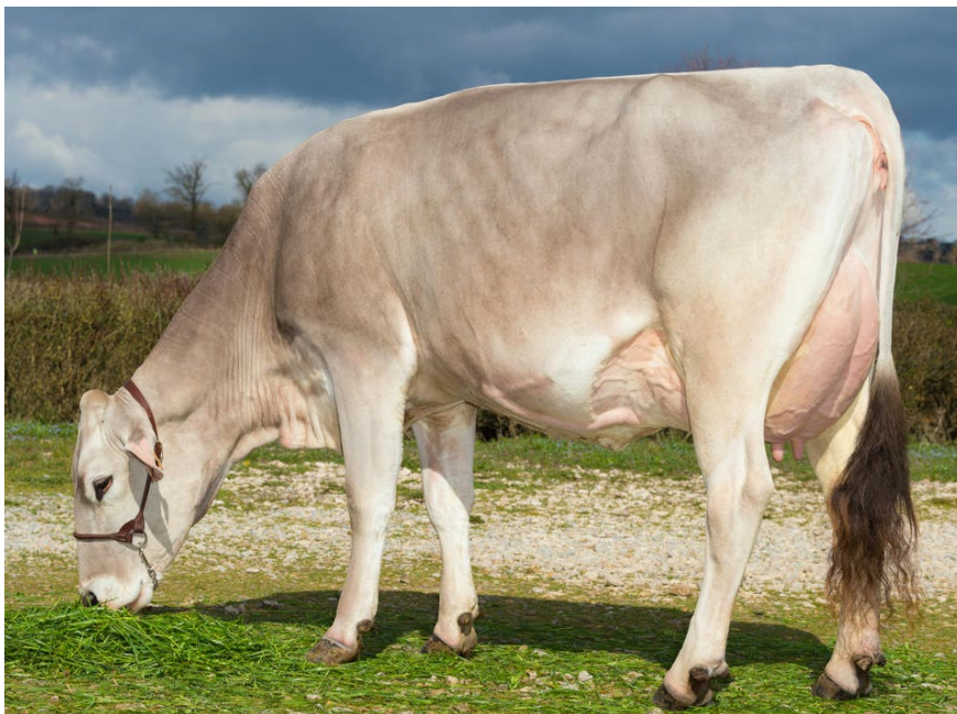
Pom Ipiano LANCELOT, mère d'Osbourne