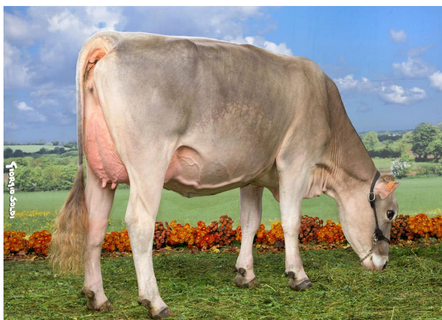
ROASLIE, fille de No Decibel