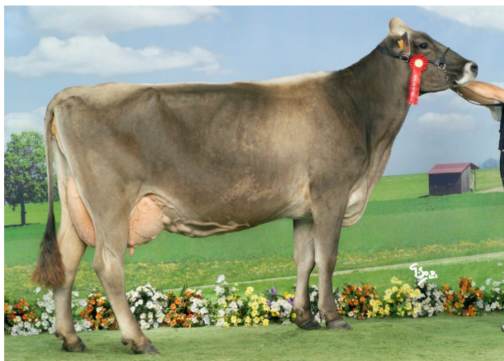
Février REGLISSE EX 91 au concours national en 2006