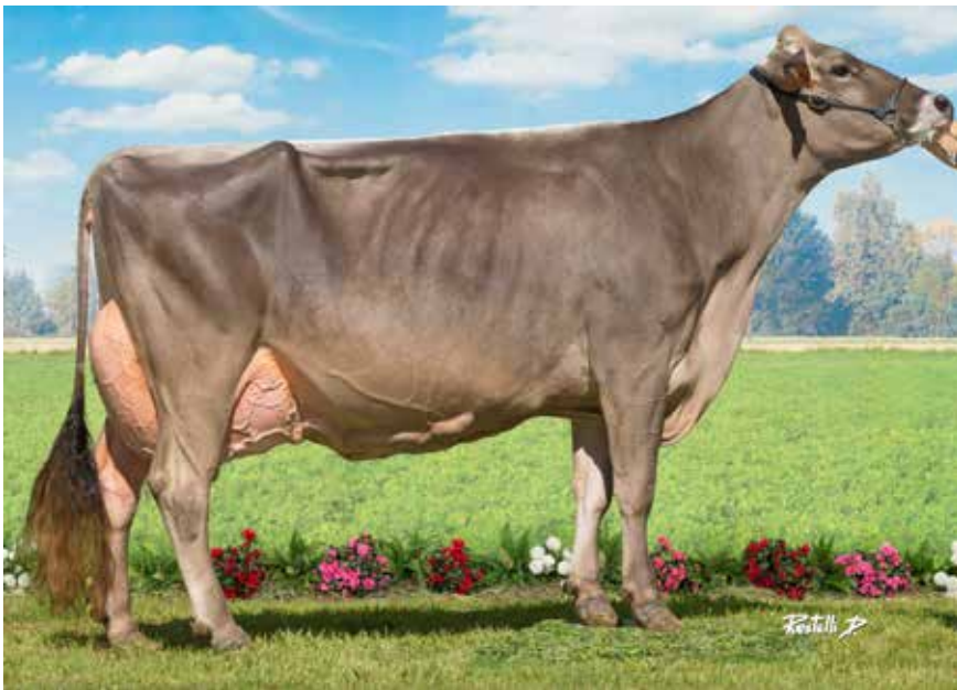
LBB GENIAL EX 90, GRAND-MÈRE DES PRODUITS À NÂÎTRE