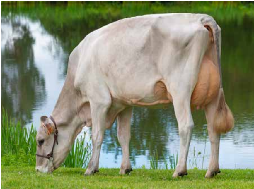
OCEANE, GRAND-MÈRE DE TITANE P