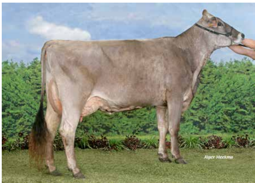
CHANCEUSE EX 92, DEMIE-SŒUR D'USAIQUE