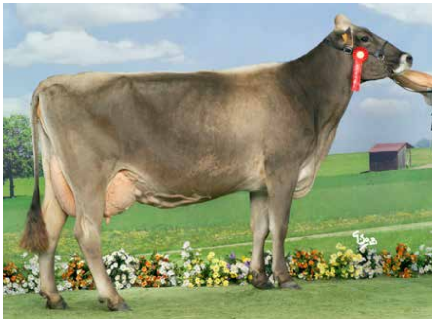
REGLISSE EX 91