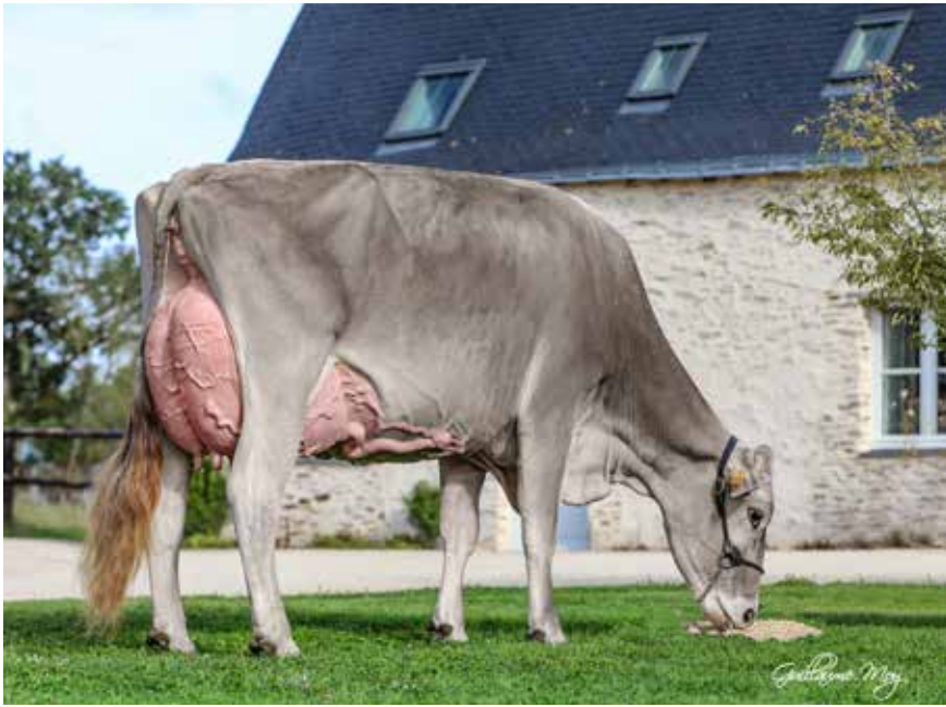
LBB LALICE EX 92, MÈRE DES PRODUITS À NÂÎTRE