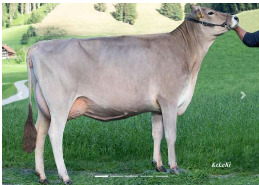
Studer's BS TIMEA, fille de TU SG