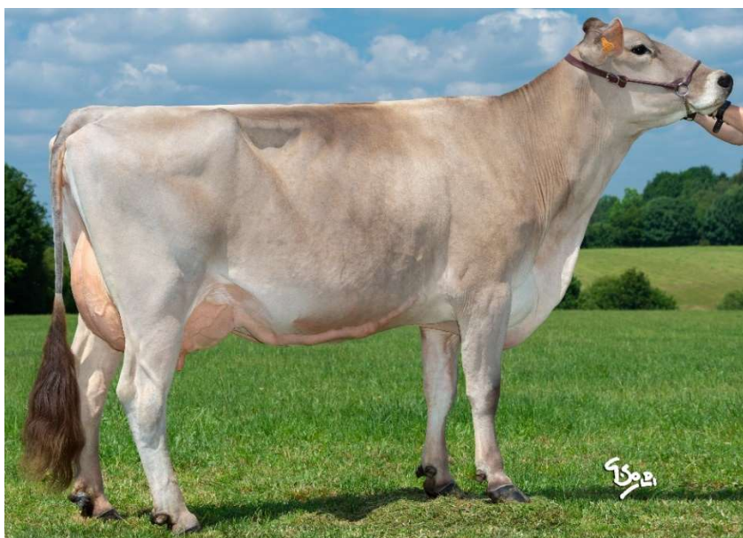
Landsaro LILIPUS TB 88 grand-mère de URSUS proposée à la vente