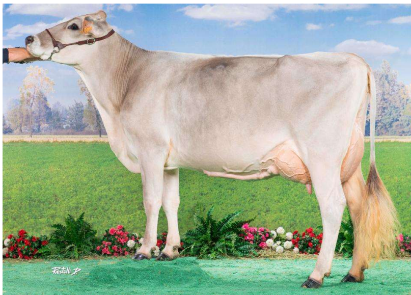
Dally HARMONIE TB 85 , 3 ème mère de LARIDA de la Saudraie proposée à la vente