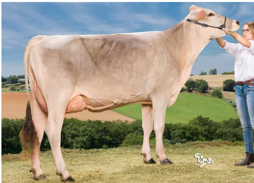
NOSDIENNE, mère de NORO