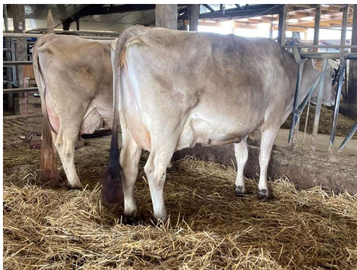
A droite LAIKA de la Perrière EX 93 grand-mère des produits à naître et à gauche OPHELIE de la Perrière TB 86 demi-sœur de la donneuse des embryons