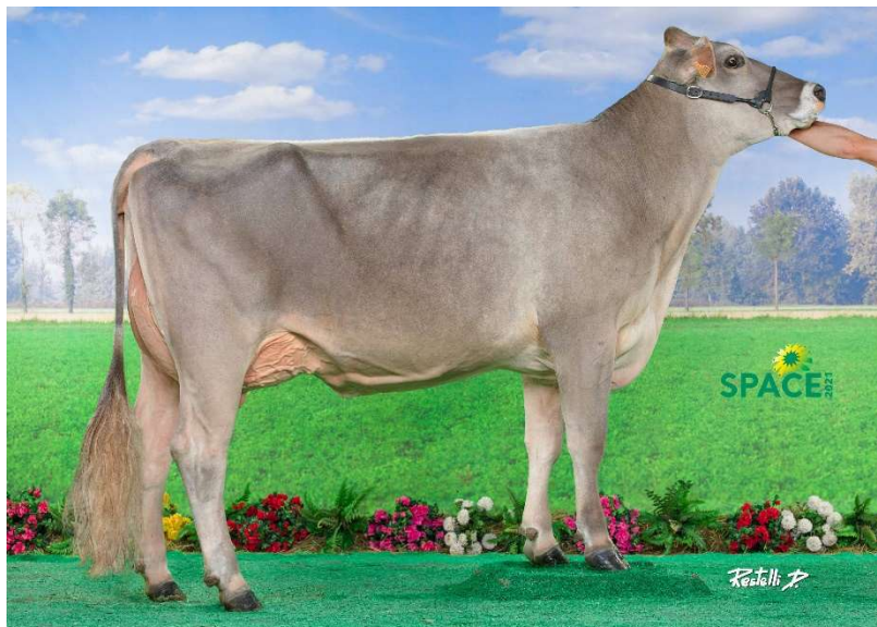
Blooming OVAL PGV TB 87, tante de MISSY PGV