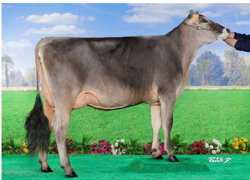
RAIADE, fille du taureau OLYMPIC