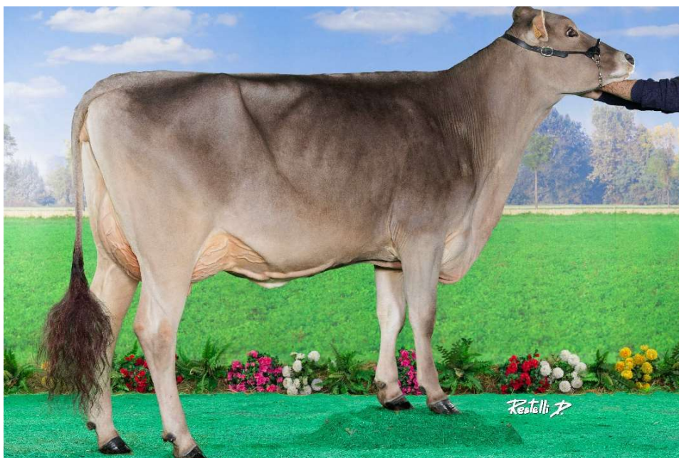
LBB RIXIE, fille du taureau O Malley