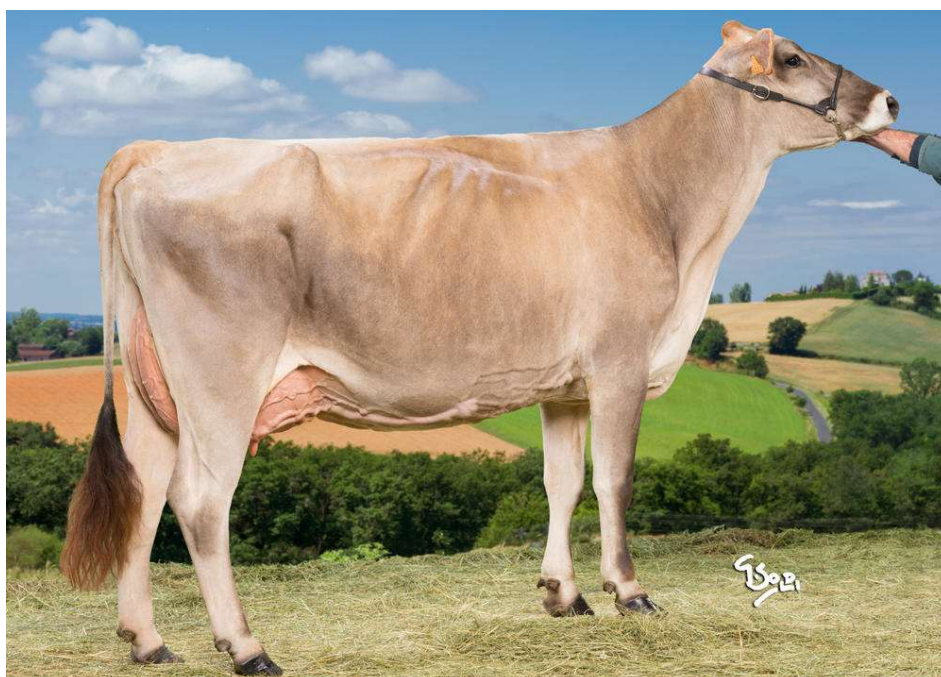
JASSE, mère de PARELOUP